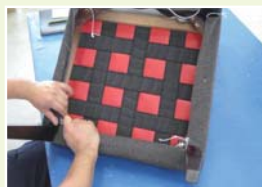
生地や革の選定などお手伝いいたします