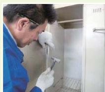
キズやへこみを修正