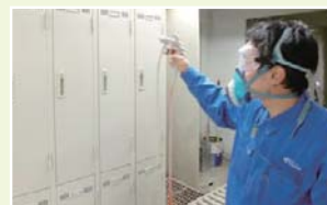
再塗装で新品同様に